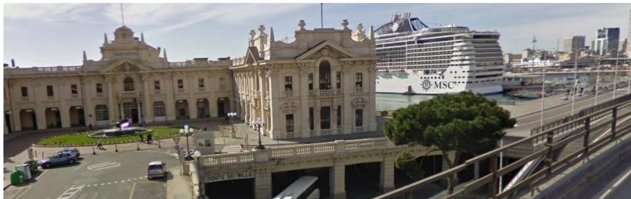
Foto: Genova Stazione Marittima - Panorama von oben von der Sopraelevata

Nach etwa 1 km sehen Sie rechts (etwas versteckt hinter den Brückenpfeilern der Sopraelevata) das imposante Gebäude vom Kreuzfahrthafen Stazione Marittima .